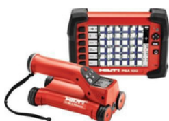
Detector de metales